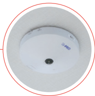
共用部に360°の広範囲を確認できる全方位カメラを設置