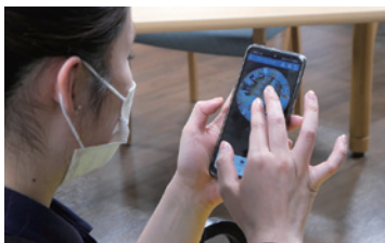
スマートフォンでの状況確認

また数社から提案を頂いた中で i-PRO Remo. サービスはクラウド経由で遠隔モニタリングができるシステムでありながら、クラウドではなく現場に設置したレコーダーに録画できるため、高額な通信費用を抑えられるという点が導入の決定打となりました。