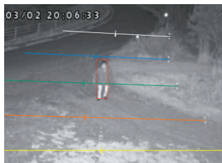
夜間の事前検証の様子。 10m以上離れていても人を検知