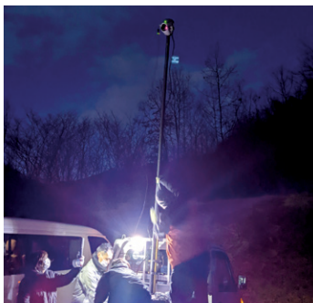
暗闇の中事前検証の準備をする様子