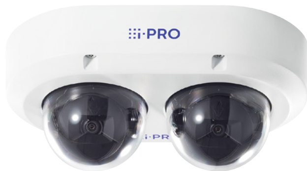
WV-S85402-V2L / WV-U85402-V2L