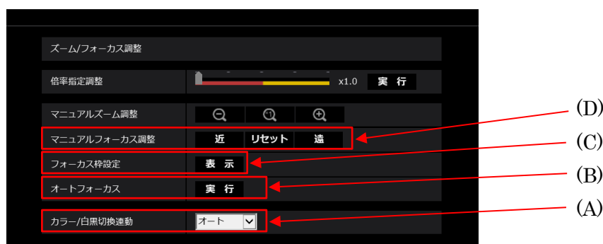
▲ [画質]タブ、[ズーム/フォーカス調整]画面