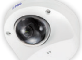
コンパクトドーム AIカメラ

疑似PTZ操作でカメラの向きを操作し、360°方向もれなく見たい場所を詳細確認できるので、転倒事故など大事なシーンを見逃すことなく事後検証することができます。