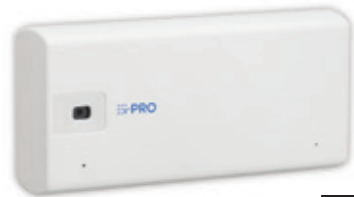
小型 AIカメラ i-PRO mini