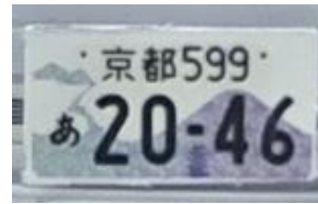
【検出エリア2の検出プレート】