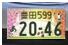
【検出エリア 1 の検出プレート】

上記のプレートが検出エリア 1 でのみ検出された場合、メタ情報は以下ようになる。