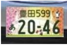
【検出エリア1の検出プレート】